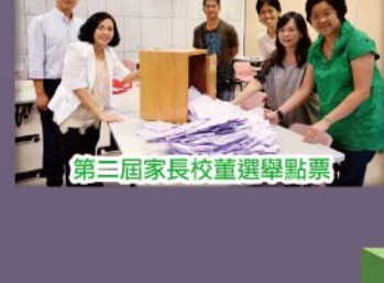
第三屆家長校董選舉點票