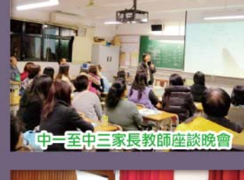
中一至中三家長教師座談晚會