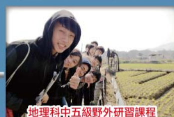
地理科中五級野外研習課程