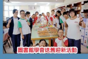
圖書館學會送舊迎新活動