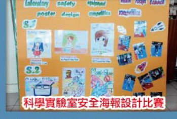
科學實驗室安全海報設計比賽