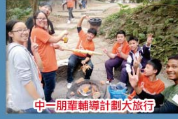
中一朋輩輔導計劃大旅行