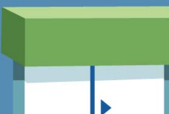
領袖生海洋公園同樂日