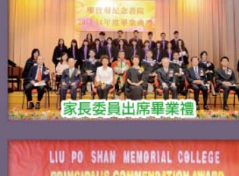
家長委員出席畢業禮