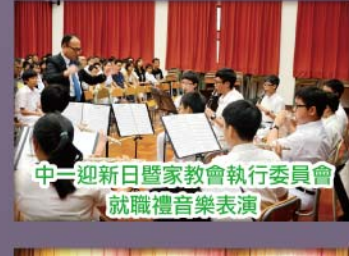
中一迎新日暨家教會執行委員會就職禮音樂表演