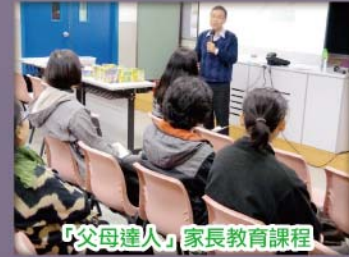
「父母達人」家長教育課程