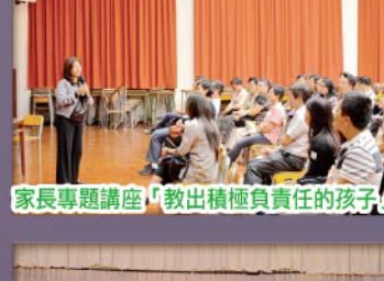
家長專題講座「教出積極負責任的孩子」