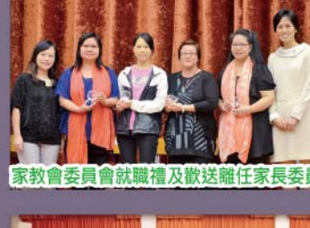
家教會委員會就職禮及歡送離任家長委員