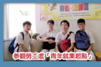
參觀勞工處「青年就業起點」