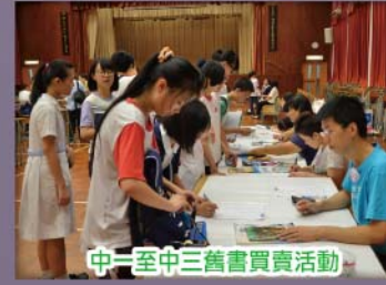
中一至中三舊書買賣活動