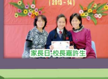
家長日-校長嘉許生