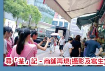
「荃」記-商舖再現(攝影及寫生)