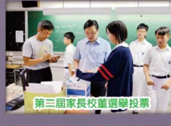
第三屆家長校董選舉投票