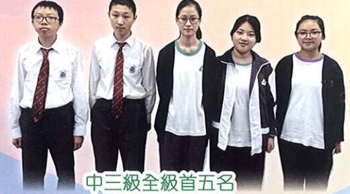
中三級全級首五名