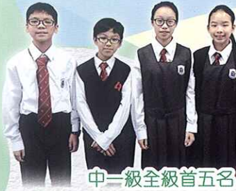
中一級全級首五名