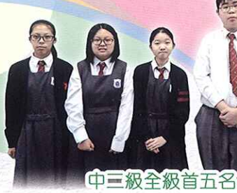
中三級全級首五名