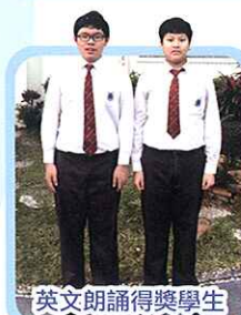
英文朗誦得獎學生