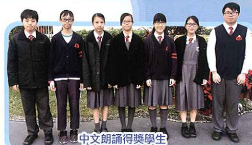
中文朗誦得獎學生