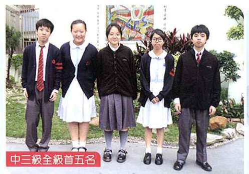
中三級全級首五名