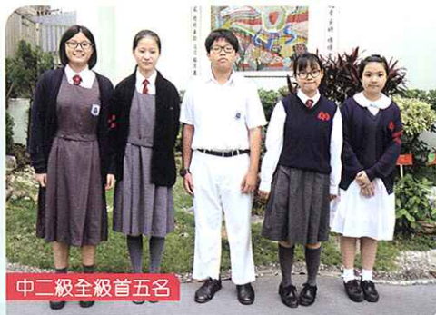
中二級全級首五名