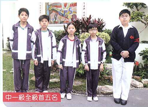
中一級全級首五名