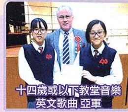
十四歲或以下教堂音樂 英文歌曲 亞軍