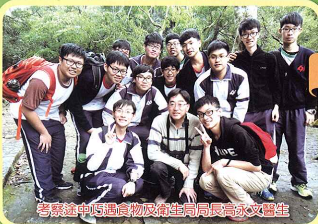
考察途中巧遇食物及衛生局局長高永文醫生

我走進樹林，頓時感受到空氣的清新。我更有機會扮演「神農氏」，嘗了兩種植物的葉子，有苦的，有甘的，味道比我想像的好。在親身了解樹木的過程中，既培養了我對大自然的興趣，也讓我學習如何保護大自然。